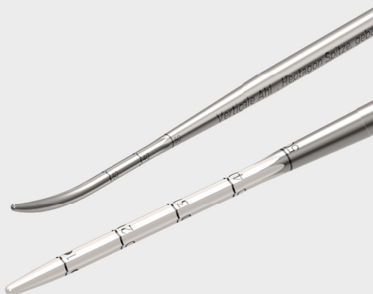
Abb. 2 Heptagon Spitzen der Ahle, gebogen und gerade